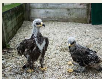
3 Pygargues à tête blanche sont nés cette année à l'Espace Rambouillet

Bon à savoir : l'aurochs est un revenant de l'ère préhistorique et sa reconstitution est un réel atout écologique, tant ses qualités de débroussaillier sont appréciables !